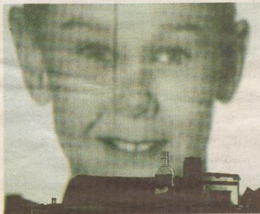
Dramacompaniets Bröder handlar om fäder, söner och barndomens minnen.